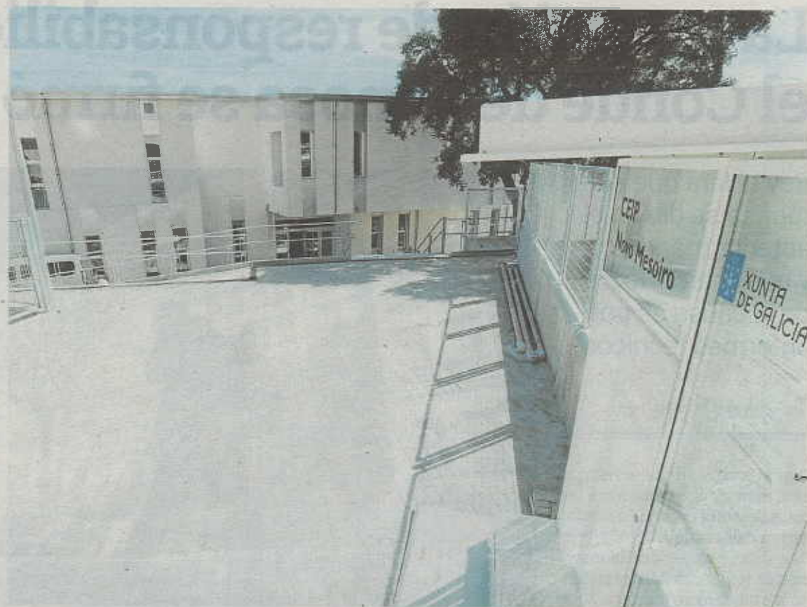
Uno de los colegios que ultima sus preparativos es el de Novo Mesoiro que se estrenará este curso

A este respecto, señala que los centros de la ciudad “ofrecen toda a seguridade que pode esixir calquera espazo para o seu uso habitual, as familias poden estar tranquilas porque os centros cumpren con todos os requisitos e temos todo preparado para que