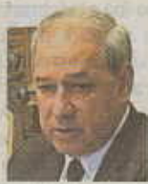
José Tomé Roca Presidente Diputación Lugo

Anunció a los 13 alcaldes que conforman el geodestino Ancares-Courel, en una reunión en el salón del organismo provincial, que la institución optará a un plan del Ministerio de Turismo que puede reportar 3 millones de euros.