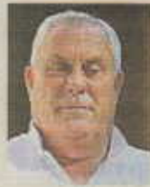
Miguel Bautista Carballo Senador PSOE Ourense

Anunció a los 13 alcaldes que conforman el geodestino Ancares-Courel, en una reunión en el salón del organismo provincial, que la institución optará a un plan del Ministerio de Turismo que puede reportar 3 millones de euros.