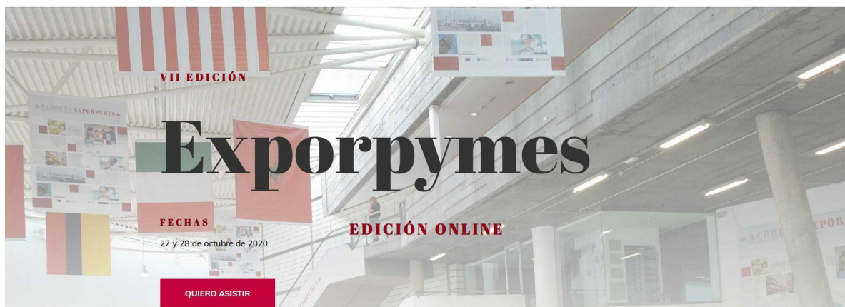
Imagen de la web de Exporpymes 2020.

Este año, debido a las especiales circunstancias provocadas por el covid-19, Exporpymes se desarrollará de forma virtual a través de una plataforma diseñada al efecto.